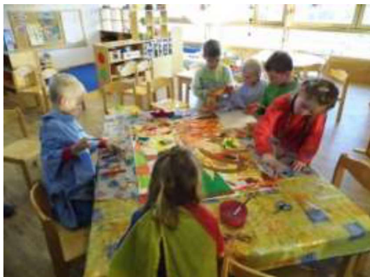
Malen mit Wasserfarben

An der Werkbank lernen die Kinder unterschiedliche Holzarten kennen und üben den Umgang mit den Werkzeugen.