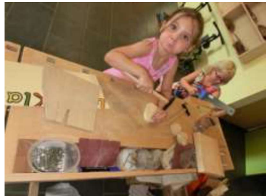
Arbeiten an der Werkbank