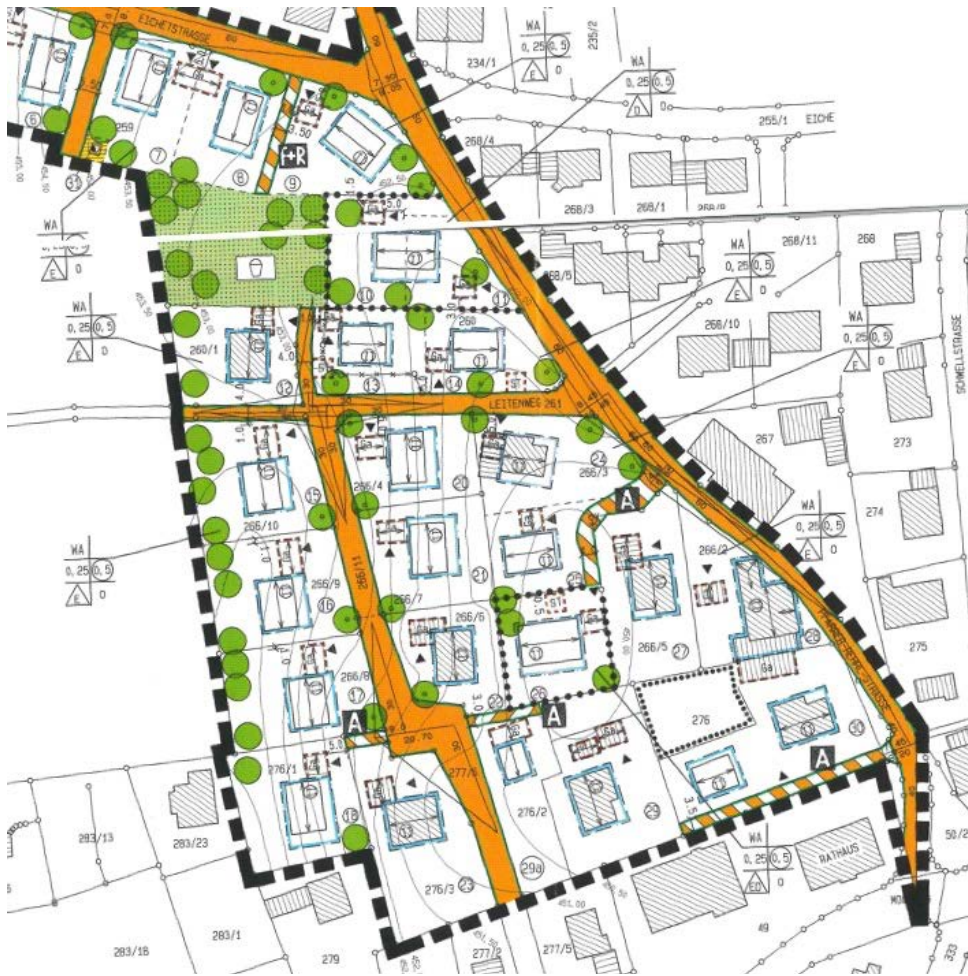
Abbildung 3: Bebauungsplan „Eichfeld“ in seiner ursprünglichen Fassung von 1996