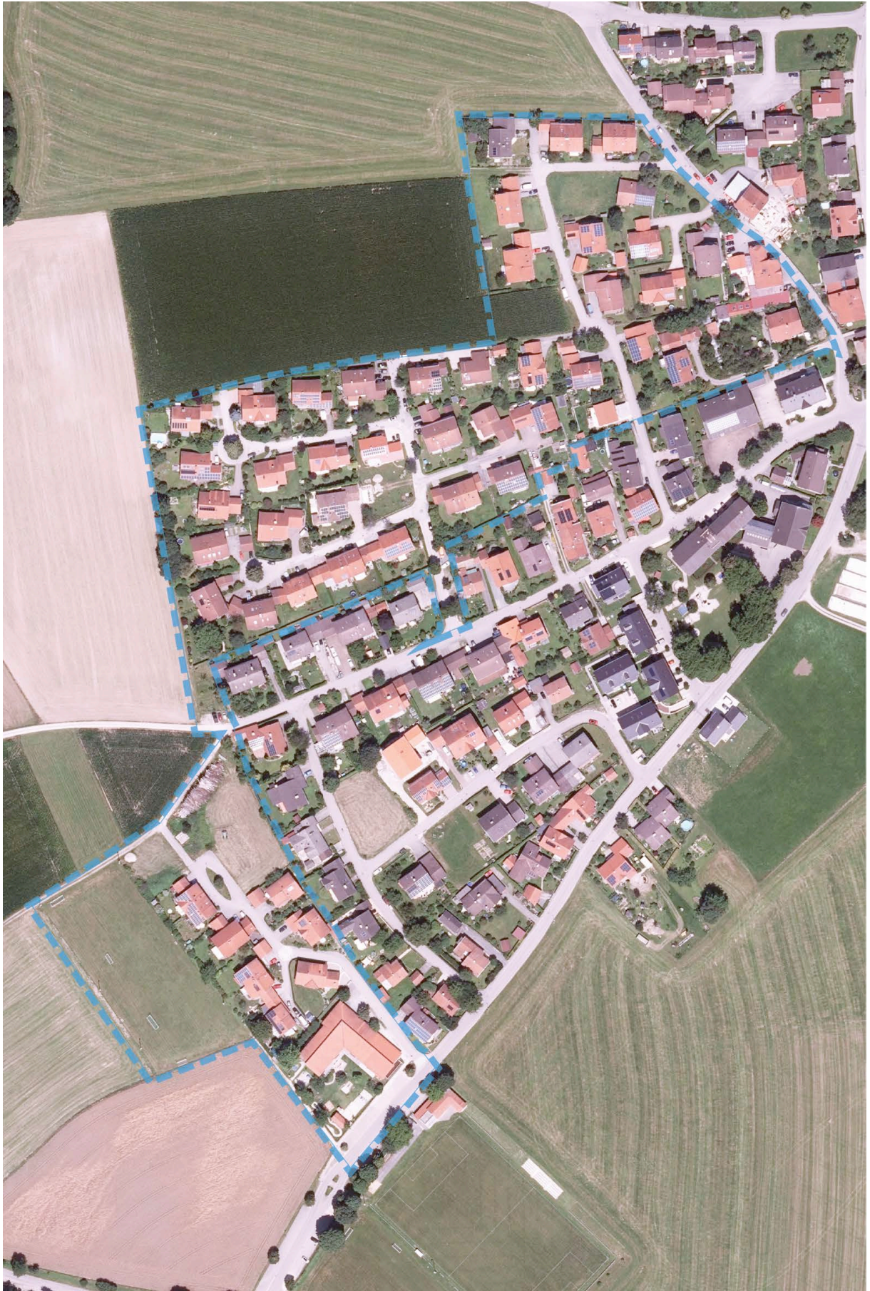
Abbildung 7: Ausschnitt aus dem digitalen Luftbild (LDBV Bayern, Aufnahmezeitpunkt 17.07.2022) mit Kennzeichnung des Plangebiets