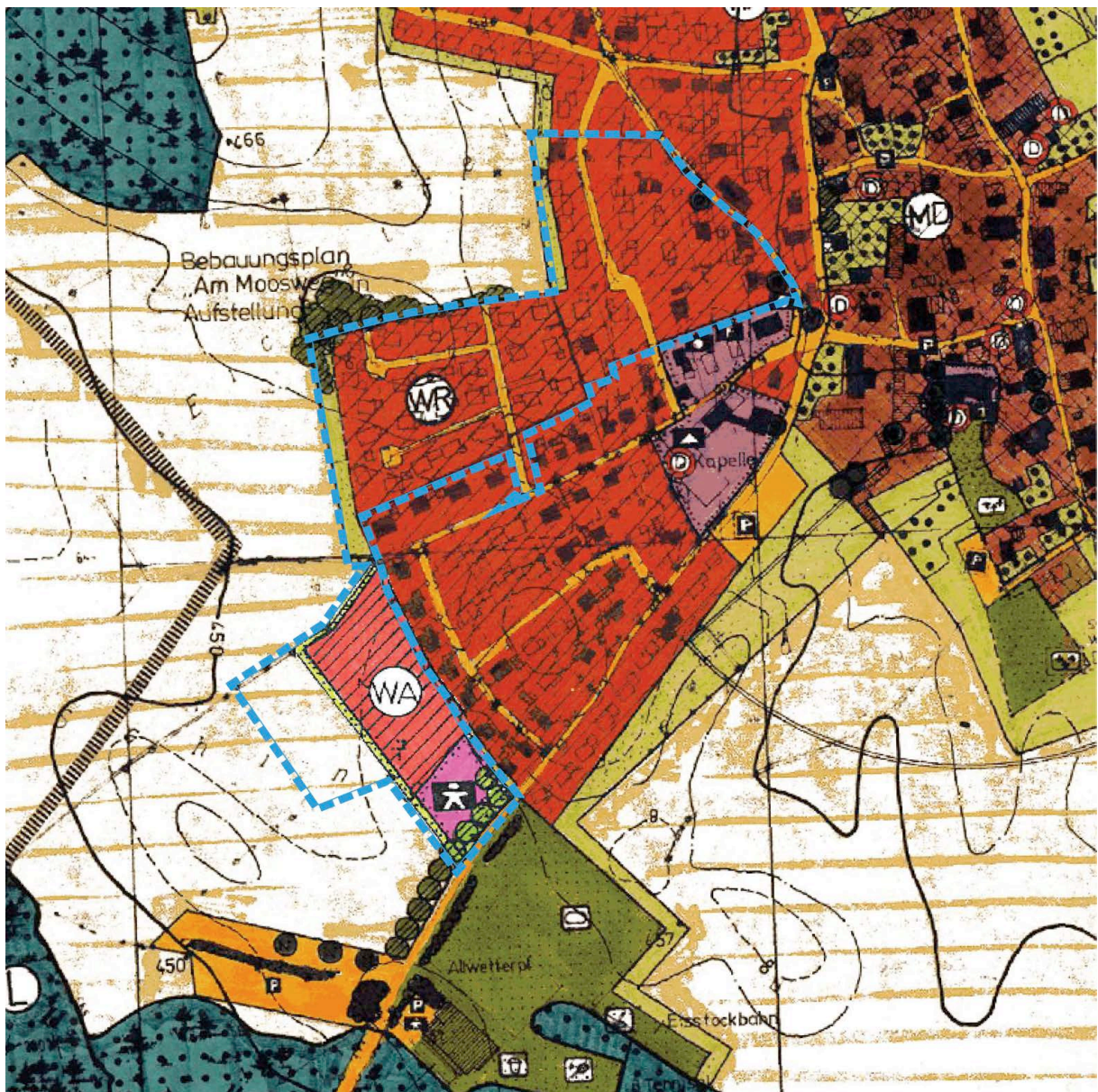
Abbildung 2: Ausschnitt aus dem gültigen FNP mit Kennzeichnung des Plangebiets (blau)

Im rechtswirksamen Flächennutzungsplan (FNP) der Gemeinde Saaldorf-Surheim sind die Flächen im Geltungsbereich des Bebauungsplans überwiegend als Allgemeines Wohngebiet, für den Geltungsbereich des Bebauungsplans „Am Moosweg“ als Reines Wohngebiet sowie im Bereich des Kindergartens als Fläche für den Gemeinbedarf mit der Zweckbestimmung Kindergarten dargestellt. Die Fläche des seit Jahrzehnten genutzten Trainingsplatzes liegt innerhalb der Flächen für die Landwirtschaft. Die an den westlichen Rändern der Wohngebiete als Flächen dargestellte Eingrünung wurden bereits in den rechtskräftigen Bebauungsplänen „Eichetfeld“, „Am Moosweg“ und „Stalberstraße“ nicht als gesonderte Flächen, sondern mit Festsetzungen innerhalb der Wohngebiete umgesetzt. Das Entwicklungsgebot nach § 8 Abs. 2 BauGB ist damit bis auf die Fläche für den Sportplatz erfüllt. Diesbezüglich wird der FNP gemäß § 13a Abs. 2 Nr. 2 BauGB im Wege der Berichtigung angepasst (s. 2.6).