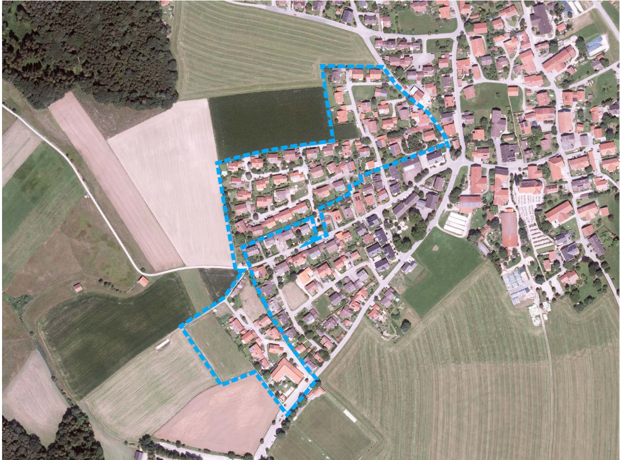
Abbildung 1: Ausschnitt aus dem digitalen Luftbild (LDBV Bayern, Aufnahmetag 17.07.2022) mit Kennzeichnung des Plangebiets