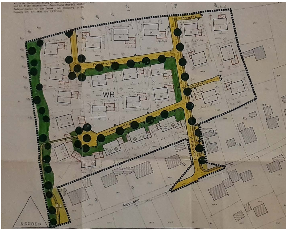
Abbildung 4: Bebauungsplan „Am Moosweg“ in seiner ursprünglichen Fassung von 1987