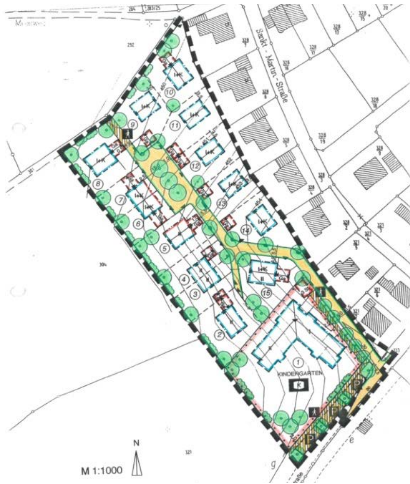
Abbildung 5: Bebauungsplan „Stalberstraße“ in seiner ursprünglichen Fassung von 1999 o.M.

An das Plangebiet grenzen im Südosten der Bebauungsplan „Saaldorf I“ und im Osten der Bebauungsplan „Saaldorf II“ an, die beide als Überarbeitung der zuvor dort geltenden Bebauungspläne 2016 in Kraft gesetzt wurden. Östlich davon wurde 2022 der Bebauungsplan „Saaldorf Altdorf“ in Kraft gesetzt.